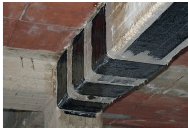
TRAVE IN CALCESTRUZZO CON RINFORZI