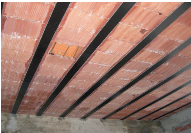
SOLAIO IN LATEROCEMENTO CON RINFORZI

Pulire il supporto rimasto a vista da proteggere; nel caso di superfici che presentino precedenti intonacature, si consiglia di procedere con idrolavaggio a pressione o energica spazzolatura manuale e/o meccanica, seguita da una pulizia profonda del supporto per eliminare completamente tutti gli strati di materiale incoerente.