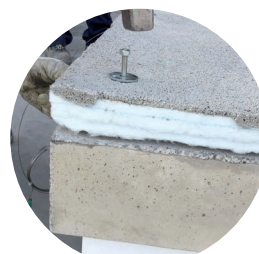
Intonaco leggero termoisolante