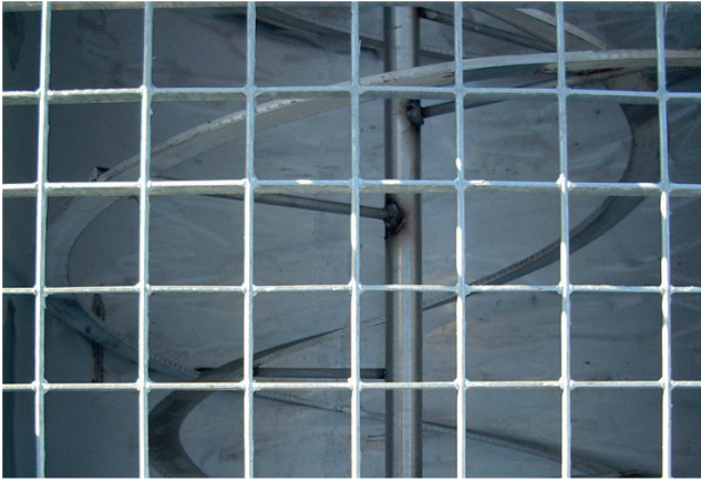
1. Elica di impasto a doppio flusso incrociato